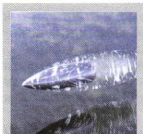
Летящая пуля кроме внутренней энергии обладает и механической

Тело, имея некоторый запас внутренней энергии, одновременно может обладать и механической энергией. Например, пуля, летящая на некоторой высоте над землёй, кроме внутренней энергии, обладает ещё и механической энергией — потенциальной и кинетической.